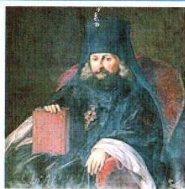
Святитель Игнатий (Брянчанинов)