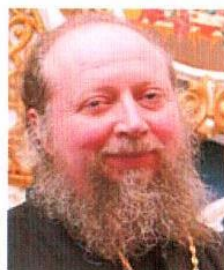
Игумен Федор (Яблоков)